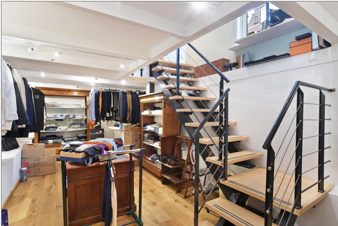
◆ Het zeer verzorgde souterrain met een goede trap en voldoende daglicht. ◆